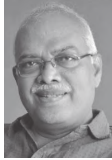
நான் தற்போது பேசுவது ஒரு கட்சியின் மேடைப் பேச்சு அல்ல. நான் கூறிய அனைத்து தகவல்களுக்கும் ஆதாரங்கள் உள்ளன. அனைத்துக்குமான புள்ளி விவரங்களும் உள்ளன.

ஒரு மாநிலத்தில் வேளாண் துறையின் பங்களிப்பு என்ன? நாளுக்கு நாள் சுருங்கிக் கொண்டே போகிறது. சுருங்குகிறதென்றால் உற்பத்தியில் இல்லை. உற்பத்தி குறைந்தால் நமக்கு உணவில்லாமல் போய்விடும். உற்பத்தி குறையவில்லை. மாறாக மற்ற தொழில் துறையின் வளர்ச்சி அதிகமாகியுள்ளது. அதனால் வேளாண் துறை சுருங்கியுள்ளது. சின்னக்கோடு ஆகிவிட்டது பக்கத்தில் பெரிய கோடு வந்ததால். எது பெரிய கோடு என்றால் சேவைத் துறை பெரிய கோடாக உள்ளது. சேவைத் துறை புதிய புதிய வாய்ப்புகளைத் திறந்து விடுகிறது. அந்த வாய்ப்புகளைப் பிடித்து முன்னேறிச் செல்லும் திறன் நம்மிடம் இருந்ததால் அதனுடைய பலனை நாம் அனுபவிக்க முடிந்தது. இது சேவைத் துறையால். ஒட்டுமொத்த பொருளாதாரம் என்று பார்த்தால் முதலில், இந்திய பொருளாதாரத்தில் தமிழகம் இரண்டாவது மிகப்பெரிய பொருளாதாரம், இரண்டாவது பரந்துபட்ட வளர்ச்சியடைந்திருப்பது, மூன்றாவது வேளாண் துறையைச் சார்ந்திருப்பவர்கள் மிகக் குறைவான ஆட்கள். நான்காவதாக சேவைத் துறை மிக முக்கியமான துறையாக வளர்ந்துகொண்டுள்ளது. இவை யெல்லாம் முக்கியமான கூறுகள். அய்ந்தாவது ஒரு