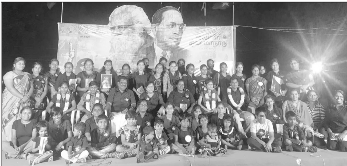
மணமக்களுடன் கழகக் குடும்பத்தினர்

இரண்டு இணையேற்பும் பிற்படுத்தப்பட்டோர் தாழ்த்தப்பட்டோர் ஆகியோர் இடையே நிகழ்ந்தவை என்பது குறிப்பிடத்தக்கதாகும்.