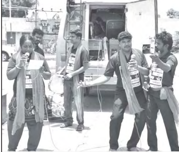
'விரட்டு' குழுவினரின் கலை நிகழ்ச்சி