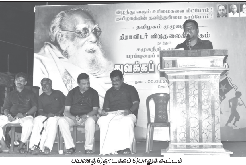
பயணத்தொடக்கப் பொதுக் கூட்டம்

மயிலாடுதுறை பயணக் குழு ஆகஸ்டு 7 ஆம் தேதியும் மேட்டூர், கோவை, மதுரை பயணக் குழு 8 ஆம் தேதியும் பயணத்தைத் தொடங்குகின்றன.