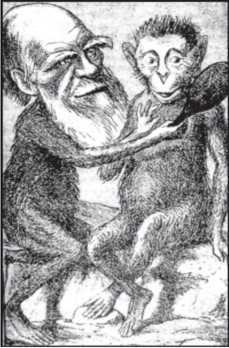
டார்வின் நூல் வெளியானபோது அவரைக் கேலிசெய்து பழமைவாதிகள் வெளியிட்டக் கருத்துப்படம்

கண்டுபிடிப்புகளை வெளிப்படுத்தினார். அரிஸ்டாட்டில் வகுத்தவையே அறிவியல் என்று நம்பப்பட்டுப் பல்கலைக் கழகங்களில் கற்பிக்கப்பட்டு வந்தது. இவற்றுள் பலவற்றைத் தவறு என்று கலிலியோ தன்னுடைய அறிவியல் செயல்முறை மூலம் எண்பித்தார். எனவே கத்தோலிக்கத் திருச்சபை கலிலியோமீது குற்றஞ்சாட்டி விசாரணை செய்தது. சூரியன் நடுநாயகமாக உள்ளது. நகராமல் உள்ளது. பூமிதான் சூரியனைச் சுற்றுகிறது என்பது தவறு என்று ஒத்துக் கொள்ளமாறு வலியுறுத்தியது. தன்னுடைய எழுபதாவது அகவையில் சிறைக் கொடுமைக்கும் மரண தண்டனைக்கும் அஞ்சி கலிலியோ தன் கோட்பாடு தவறு என்று திருச்சபை முன் மண்டியிட்டு ஒத்துக்கொண்டார். ஆயினும் 1633 முதல் அவர் இறக்கும்வரை வீட்டுக் காவலில் வைக்கப்பட்டார்.