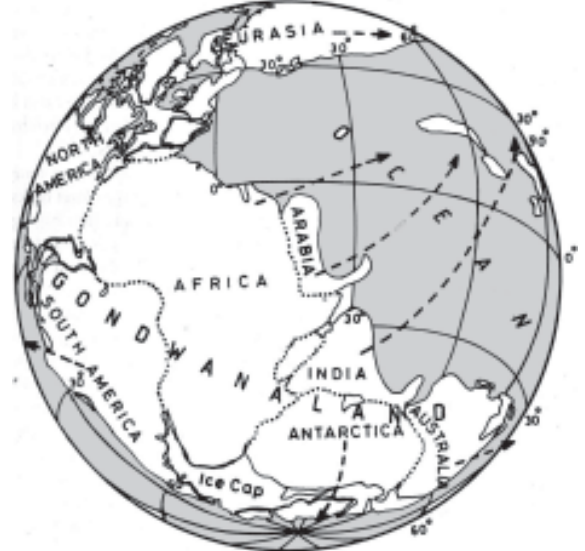
23 கோடி ஆண்டுகளுக்குமுன் நிலப்பரப்பு தொடர்ச்சியான ஓரே பகுதியாக இருந்ததை விளக்கும் படம் (இர்ஃபான் அபீப் நூல்)

இங்கிலாந்து நாட்டைச் சேர்ந்த தாமஸ் ராபர்ட் மால்தாஸ் (1776 - 1834) என்பவர் 1798இல் மக்கள்தொகைக் கோட்பாடு என்ற நூலை வெளியிட்டார். இந்நூலை டார்வின் 1838இல் படித்தார். மக்கள்தொகை பெருக்கல் விகிதத்தில் (2, 4, 8, 16 ... ..) உயர்கிறது. ஆனால் உணவு உற்பத்தியோ கூட்டல் விகிதத்தில் (1, 2, 3, 4