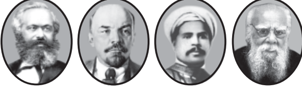
மார்க்கு லெனின் சிங்காரவேலர் பெரியார்