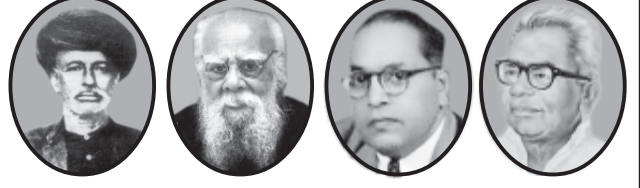
புலே பெரியார் அம்பேத்கர் லோகியா