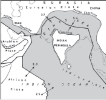
6.5 கோடி ஆண்டுகளுக்குமுன் தென்னிந்தியா மட்டுமே நிலப்பகுதியாக இருந்தது. வட இந்தியா கடலாக இருந்ததை விளக்கும் படம். (இரிஃபான் அபீப் நூல்)

←→ Divergent plate motion in cms — Palaeo Coastline →← Convergent plate motion in cms ··· Present Coastline