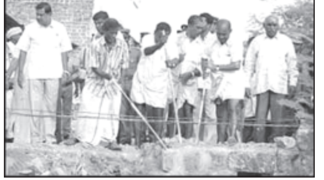
இடிக்கப்படும் தீண்டாமைச் சுவர்

பிள்ளைமார் சமூகத்தினரின் முத்தாலம்மன் கோவிலைச் சுற்றியுள்ள இடத்திற்கு பட்டா வேண்டும் என்ற கோரிக்கை அரசால் ஏற்றுக் கொள்ளப்பட்டு ஆவன செய்து தருவதாக உத்தரவாதம் கொடுக்கப்பட்டுள்ளது. சுவரை பொறுத்தவரை இரு பிரிவினருக்கும் பாதகம் இல்லாமல் முடிவு எடுக்கப்படும் என்றும் முதல்வர் கூறியுள்ளார்.