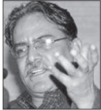
பிரசண்டா பாதையில் பாட்டாளிவர்க்க சர்வாதிகாரம் உண்டா - 28 தமிழ்த்தேசியன்