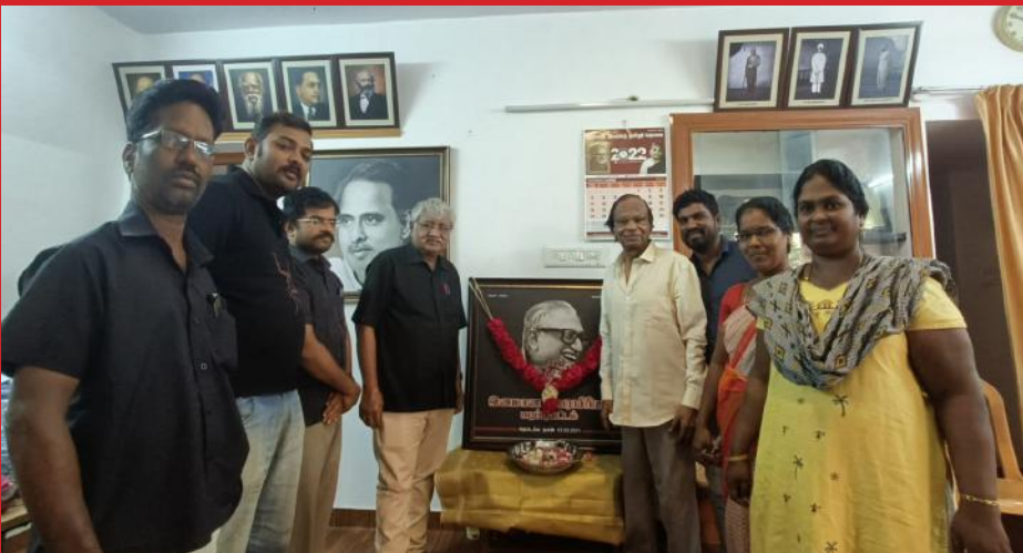
19.12.2022 அன்று பேரவையின் தலைமை அலுவலகத்தில் பேராசிரியர் அன்பழகனாரின் பிறந்தநாளை முன்னிட்டு அவரது படத்திற்கு மலர் தூவி மாலை அணிவிக்கப்பட்டது.

இந்த வயது நீட்டிப்பால், ஊழியர்கள் ஓய்வு பெறுவது தாமதமான நிலையில் காலிப்பணியிடங்கள் உருவாகாததால், தேர்வாணைய அறிவிப்பில் குரூப் 2/4 தேர்வுக்கான அறிவிப்புகள் இடம்பெறவில்லை என்று சொல்லப்படுகிறது.