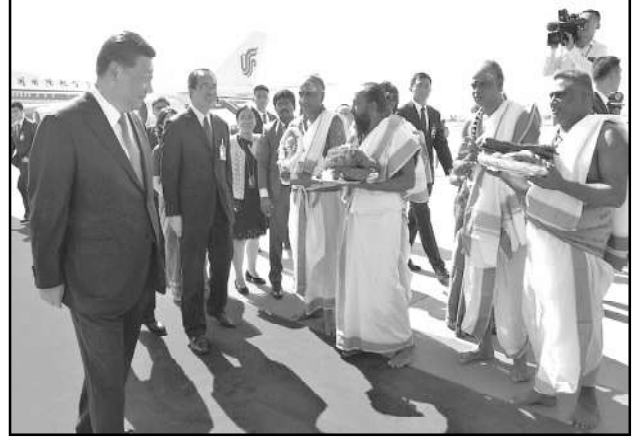
வானூர்தி நிலையத்தில் சீன அதிபர் சிங்பிங் பூர்ண கும்ப மரியாதைத் தட்டுகளுடன் நிற்கும் குருக்கள் முன்பு நிற்காமல் நடந்து செல்கிறார்.

வானூர்தி நிலையத்தில் சீன அதிபர் சிங்பிங் அவர்களை வரவேற்க கபாலீசுவரர் கோவிலின் தலைமைக் குருக்கள் உள்ளிட்ட 5 குருக்கள் காத்திருந்தனர். சீன அதிபருக்குப் பூர்ணகும்ப மரியாதை அளிப்பது அவர்களின் திட்டம். வானூர்தியிலிருந்து இறங்கி சிவப்புக் கம்பள விரிப்பில் நடந்து வந்த சீன அதிபர் அவரை வரவேற்க அங்கே நின்று கொண்டிருந்த ஒவ்வொரு கலைக் குழுவினரையும் நின்று பார்த்துச் சென்றார். மந்திரம் ஒதி, பூர்ண கும்ப மரியாதை அளிக்கப்பட ஏதுவாக சீன அதிபர் அங்கே நிற்கவில்லை. அவர் அந்த மரியாதையை ஏற்கவில்லை என்று விமர்சகர்கள் கூறுகிறார்கள்; பூர்ணகும்ப மரியாதையை ஏற்றுக் கொள்வது பற்றி சீன அதிபருக்குச் சீன அதிகாரிகள் தெரிவிக்கவில்லை என்றும் குறை கூறுகிறார்கள்.