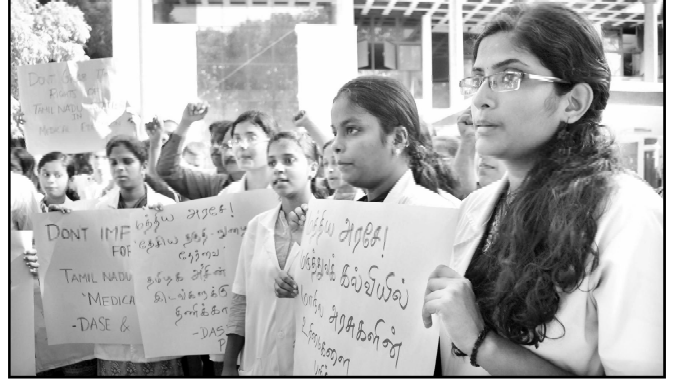
நீட் தேர்வுக்கு எதிராக மருத்துவக் கல்லூரி மாணவிகள்

செயலிதாவின் மறைவுக்குப்பின் ஆளும் அ.தி.மு.க.வில் ஏற்பட்ட குழப்பங்களுக்குப்பின் கூட்டப்பட்ட சட்டப்பேரவைக் கூட்டத்தில் தமிழ்நாட்டில் உள்ள அரசு மருத்துவக் கல்லூரிகளில் உள்ள இடங்களுக்கும், தனியார் மருத்துவக் கல்லூரி