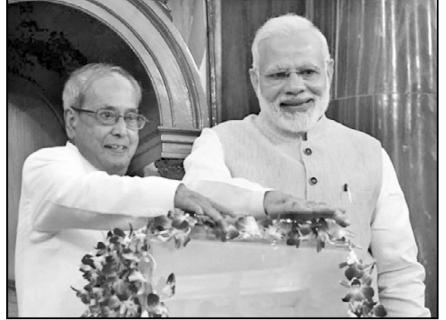
2017 சூன் 30 நள்ளிரவில் நாடாளுமன்ற மைய மண்டபத்தில் நரேந்திரமோடி ஜி.எஸ்.டி.யைத் தொடங்கி வைத்தார்.

ஜி.எஸ்.டி. குறித்து மக்களவையில் 2016 ஆகத்து 8 அன்று நரேந்திர மோடி உரையாற்றிய போது, “காந்தியார் 1942 ஆகத்து அன்று ‘வெள்ளையனே வெளியேறு’ இயக்கத்தைத் தொடங்கினார். அதுபோல் ஜி.எஸ்.டி. இந்தியர்களை ‘வரி பயங்கரவாதத்திலிருந்து’ விடுவிக்கும்” என்று கூறினார். ஜி.எஸ்.டி.க்கான எதிர்ப்பை முறியடிப்பதற்காக, நாட்டின் பொருளாதார