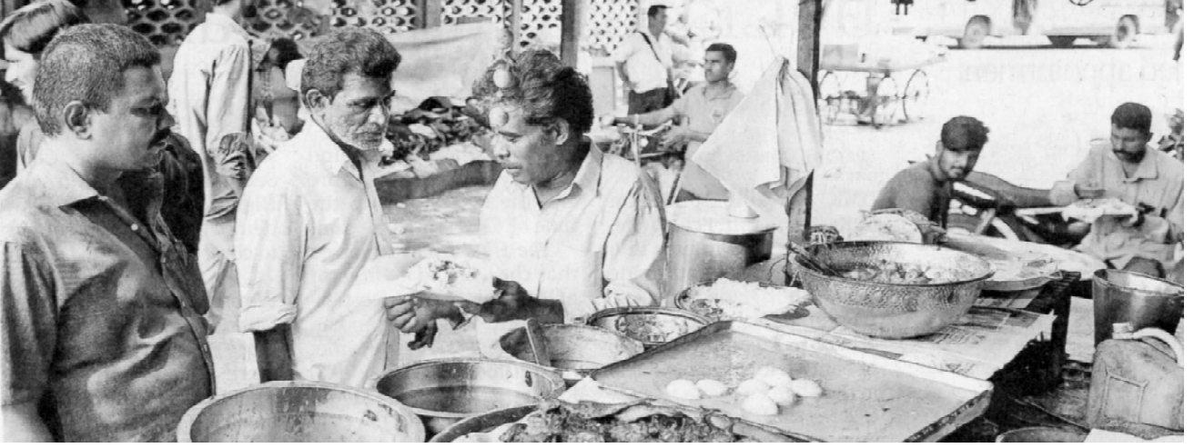
ஜி.எஸ்.டி.யால் உணவகங்களில் விலைகள் உயர்ந்ததால் தெருவோரக் கடைகளை நாடும் மக்கள்

பரிந்துரையின் பெயரில் முதன்முதலில் விற்பனை வரியை விதித்தார். இந்த விற்பனை வரிதான் வாட் வரியாக மாறி இன்று சரக்கு-சேவை வரியில் இணைக்கப்பட்டுள்ளது. ஆனால் 1935ஆம் ஆண்டு பிரித்தானிய அரசியல் சட்டத்தில் மாகாணங்களுக்கு ஒதுக்கப்பட்ட வரிகளைக் கூட, 1950க்குப் பிறகு ஒவ்வொன்றாக ஒன்றிய அரசுப் பிடுங்கிக் கொண்டே வருகிறது. இதில் இறுதிக் கட்டம்தான் இன்றைய சரக்கு சேவை வரியாகும். 1950இல் இந்திய அரசமைப்புச் சட்டம் நடைமுறைப்படுத்தப்பட்ட போது, சேவை வரியைப் பற்றி எந்த விதீயும் இடம்பெறவில்லை.