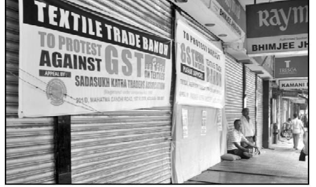
ஜி.எஸ்.டியால் ஜவுளித் தொழில் கடுமையாக பாதிக்கப்படுவதை கண்டித்துக் கட்டையடைப்பு

குறிப்பாக வேளாண் துறையில் மிகை உற்பத்தி இருந்தால் வரி விதிப்பதில் தவறில்லை என்றும் வாதிட்டார்கள். ஆனால் இக்காலக்கட்டத்தில் Mercantilism என்ற பொருளாதாரக் கொள்கையை இங்கிலாந்தில் இருந்த சில பொருளாதார எழுத்தாளர்கள் வலியுறுத்தினர். இங்கிலாந்து அரசு வலிமையாக இருக்க வேண்டுமென்றால் வரிவிதிப்பை விரிவாக்கம் செய்ய வேண்டும் என்று குறிப்பிட்டனர். இதைத்தான் பொருளாதார நூல்களில் 'வணிகஇயல் கொள்கை' (Mercantilism) என்று குறிப்பிடுகின்றனர். இதற்கு எதிர்ப்பாகப் பிரெஞ்சு இயற்கையாளர்கள் வரியின் சுமையை மக்கள் மீது ஏற்றக்கூடாது என்று வாதிட்டனர். இக்காலக்கட்டத்தில் உருவான பொருளாதாரமே அரசியல்