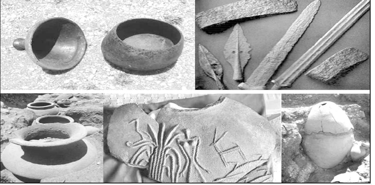
ஆதிச்சநல்லூர் அகழ்வாய்வில் கண்டெடுக்கப்பட்ட பொருள்கள்

அகழ்வாய்வு நடத்திய போது, பல அரிய பொருள்கள் கிடைத்தன. அவை பெர்லின் அருங்காட்சியகத்தில் வைக்கப் பெற்றுள்ளன.