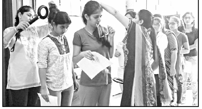
நீட தேர்வின்போது அவமானப்படுத்தும் வகையில் சோதனைக்கு உட்படுத்தப்பட்ட மாணவிகள்

17.7.2017 அன்று சென்னை உயர்நீதிமன்றம், மாநிலத் திட்டத்தில் படித்த மாணவர்களுக்கு மருத்துவப் படிப்பில் 85 விழுக்காடு வழங்கும் தமிழக அரசின் ஆணையைச் செல்லாது என்று அறிவித்தவுடன் தமிழக அமைச்சர்கள் விஜயபாஸ்கர், ஜெயகுமார், சி.வி. சண்முகம், கே.பி. அன்பழகன், பி. தங்கமணி ஆகியோர் தில்லிக்குச் சென்றனர். 20.7.2017 அன்று இவர்கள் நடுவண் அரசின் மக்கள் நல்வாழ்வுத் துறை அமைச்சர் ஜெ.பி. நடரா, கல்வி அமைச்சர் ஜவடேகர், சட்ட அமைச்சர் இரவிசங்கர் பிரசாத் ஆகியோரைச் சந்தித்து தமிழ்நாடு சட்டமன்றம் இயற்றிய சட்டத்துக்குக் குடியரசுத் தலைவரின் ஒப்புதலைப் பெற்றுத் தருமாறு வேண்டினர். அதன்பின் மு. தம்பித்துரையின் தலைமையில்