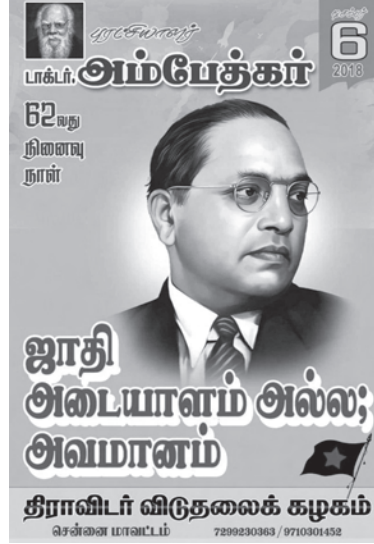
சென்னை மாவட்டம் முழுவதும் ஒட்டப்பட்டுள்ள கவரொட்டி