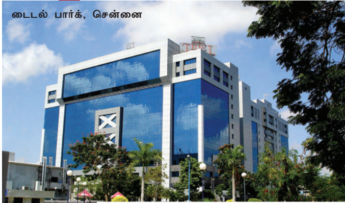
டைடல் பார், சென்னை