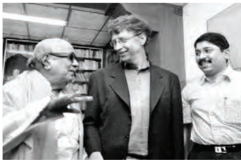
கலைஞருடன் பில் கேட்ஸ், தயாநிதி மாறன்...

இந்தியாவிலேயே முதல் மாநிலமாகத் தமிழ்நாட்டில் 1997 இல் விரிவான தகவல் தொழில்நுட்பக் கொள்கையைக் கலைஞர் உருவாக்கினார். 1998இல் தேசிய தகவல் தொழில்நுட்பக் கொள்கையை நடைமுறைப்படுத்துவதற்கு முன்னரே தமிழ்நாட்டில் செயல்படுத்தப்பட்டது.