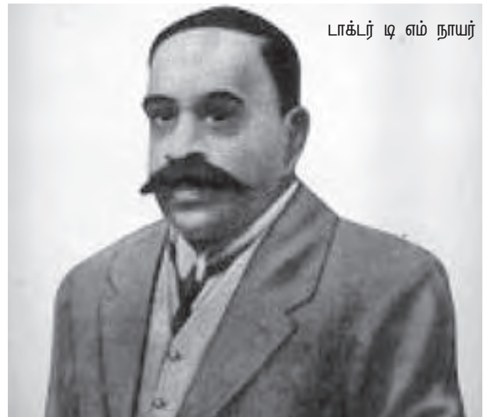
டாக்டர் டி எம் நாயர்

கைம்மாறாக இந்தியரைத் திருப்திப்படுத்தும் வகையில் Government of India Act எனும் இந்திய அரசியல் சட்டம் 1919இல் ஐக்கிய இராஜ்ய நாடாளுமன்றத்தில் ஒரு சட்டமாக நிறைவேற்றப்பட்டது. 1919இல் பிரித்தானிய இந்தியாவின் தலைமை ஆளுநராக இருந்த செம்ஸ்போர்டு பிரபு மற்றும் பிரித்தானிய இந்திய அரசின் செயலாளர் எட்வின் சாமுவேல் மாண்டேசுவும் இணைந்து, சென்னை வங்காளம் பம்பாய் மத்திய மற்றும் பஞ்சாப் மாகாணங்களில் வரையறுக்கப்பட்ட அதிகாரங்களுடன், மக்கள் பிரதிநிதிகள் கொண்ட சட்டமன்றங்கள் நிறுவப்படவேண்டியும், பிரித்தானிய இந்திய மாகாண நிர்வாகங்களில் இந்தியர்களுக்குச் சுயாட்சி